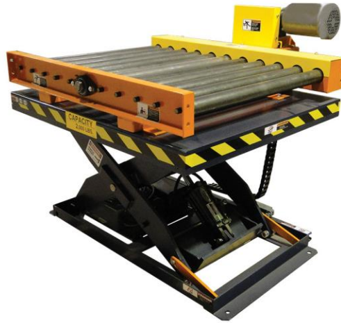
1. ábra - Emelőasztal

A feladat egy, az 1. ábrán láthatóhoz hasonló, futószalaggal ellátott emelőasztal irányítása.